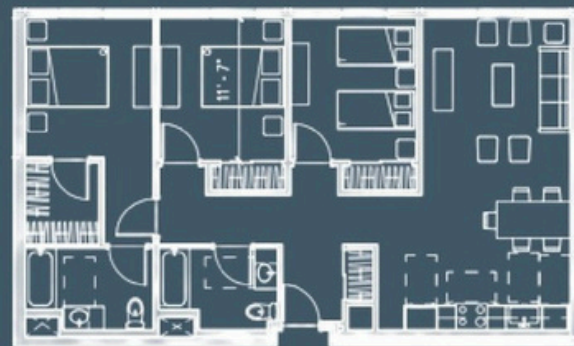
3 habitaciones, 2 baños, 1110 pies cuadrados

Los metros cuadrados son aproximados y pueden variar según la unidad.