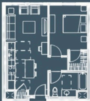
1 dormitorio/1 baño, 555 pies cuadrados