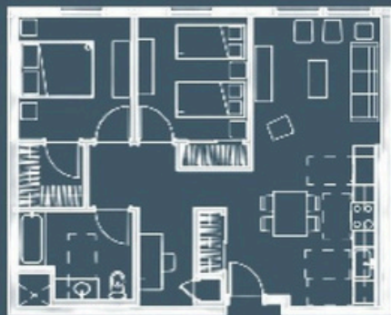
2 habitaciones/1 baño, 820 pies cuadrados