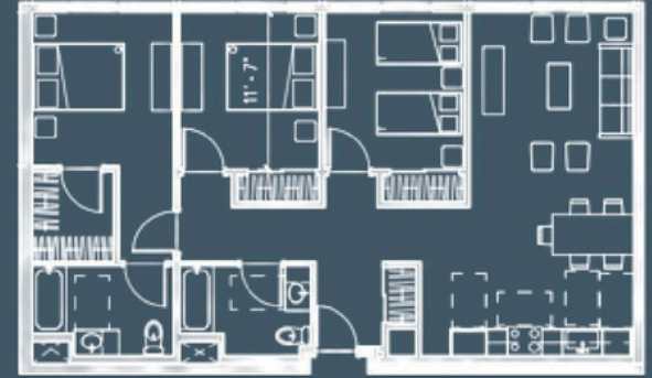
3 habitaciones, 2 baños, 1110 pies cuadrados

Los metros cuadrados son aproximados y pueden variar según la unidad.