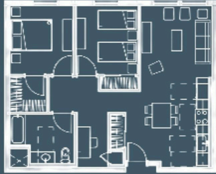
2 habitaciones/1 baño, 820 pies cuadrados