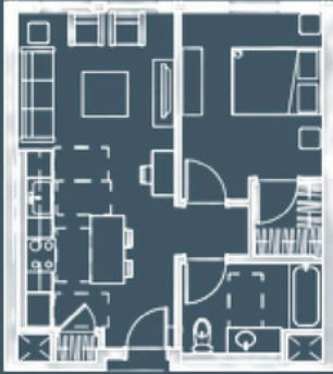
1 dormitorio/1 baño, 555 pies cuadrados